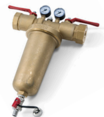
Ausführung „plus“ mit Holländerverschraubung

Waagerechter Einbau zwischen zwei Absperrorganen im Heizungsrücklauf.