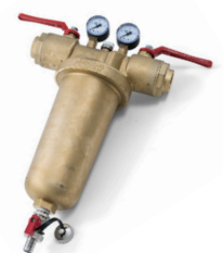
Ausführung „plus“ mit beidseitigem IG